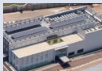
屋上の太陽光発電システム (高岡創造ラボ)

2021年12月、当社は「2050年カーボンニュートラル(実質ゼロ)」を目標に掲げました。温室効果ガス(GHG)排出量削減目標を「2030年に2013年比26%削減」から「50%削減」に見直し、「2050年カーボンニュートラル」に向け気候変動がサプライチェーンを含めた当社の事業に及ぼすリスクと機会を把握し、目標達成に向けた今後の対応を明確にしました。当社は、気候変動抑制への取組みを最重点課題として、引続きGHGの排出量削減を意欲的に推進します。