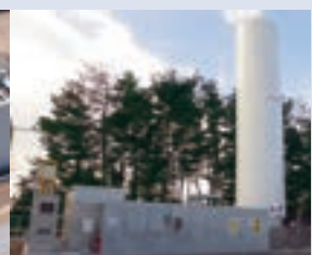
低環境負荷燃料ボイラー (広野工場)