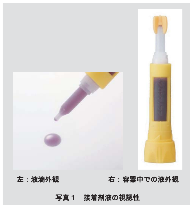
写真1（右） のように塗布後の液滴の視認性が良好であり、また 写真1（左） に示すように、液残量確認が一目で確認できるようになった。

続いて、硬化に伴う色の变化について述べる。 写真2 にスライドガラスとカバーガラスで挟んだ際の色の变化を示す。硬化反応とほぼ同じ時間で、目標通り硬化後の色が無色透明になることが分かる。